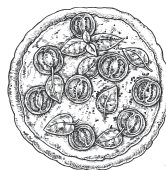
Petite pizza tomate ou Colin pané et petits légumes